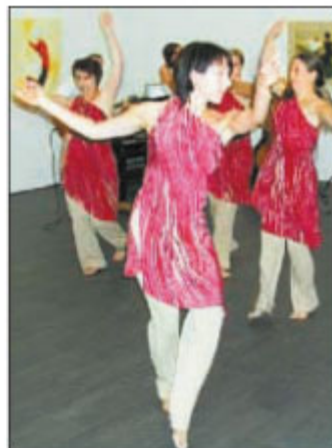
Dance Motion in Aktion.