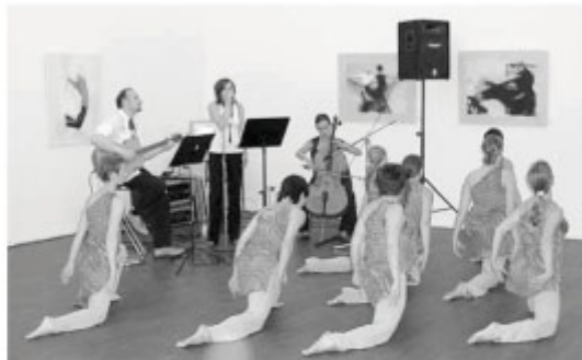
Die „Dance Motion“ der Turnerschaft und „Vorhof2“ bei ihrer gemeinsamen Performance.